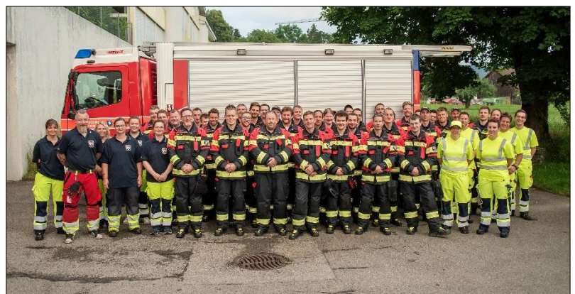
Die erste Feuerwehr freut sich über die neue Ausrüstung!