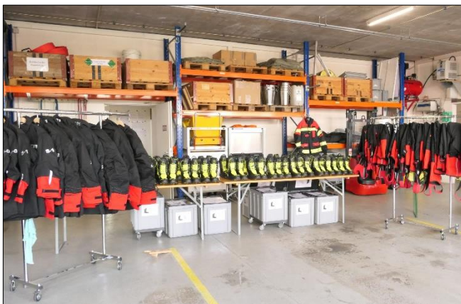
Bereit für die Anmessung im Feuerwehrlokal.

Neun Organisationen haben sich bereits für die Warm-up-Phase angemeldet. Die entsprechenden Mietverträge sind unterzeichnet. Während dieser Phase bringen wir die Anmess-Sätze direkt zu den Feuerwehren. Pro Stunde können etwa 25 AdF angemessen werden. Für den Betrieb ab 2025 planen wir regionale Anmess-Center, die je nach Lage der Feuerwehren eingerichtet werden.