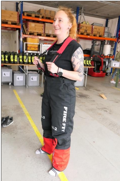
Die Hose ist noch etwas zu gross.