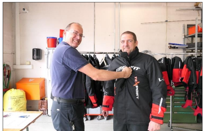
Mit einem Prüfgriff wird die Jackengrösse kontrolliert.