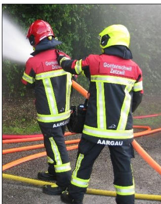
Die Ausrüstung im Einsatz.

Rund 500 Garnituren werden den Warm-up-Feuerwehren, dem Sales-Team, dem Pikett-Team der AGV sowie den Brandursachenermittlern der Kantonspolizei Aargau noch vor oder unmittelbar nach den Sommerferien ausgeliefert. Erste Gespräche mit weiteren Feuerwehren für das kommende Jahr wurden bereits geführt. Weitere Feuerwehren werden nach den Sommerferien von unserem Sales-Team besucht und erhalten vor Ort eine Produkte- und Vertragsvorstellung.