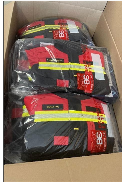
Einzeln, pro Person verpackt und geliefert.