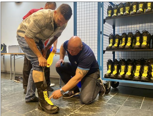
Die Lieferanten erklären, worauf das Sales Team bei der Anmessung achten muss.

Sollte dennoch nichts passen, bieten wir auch Spezialanfertigungen an. Für die Anmessungen direkt bei Ihnen vor Ort haben wir zwei Anhänger angeschafft, die jeweils zwei komplette Anmess-Sätze und diverses Zubehör mitführen. Zwei weitere Anmess-Sätze stehen in der AGV bereit, hauptsächlich für Einzelanmessungen. Diese sind für Angehörige der Feuerwehr (AdF) gedacht, die keinen Anmess-Termin vor Ort wahrnehmen konnten, oder für AdF, die kurzfristig in die Feuerwehr eintreten.