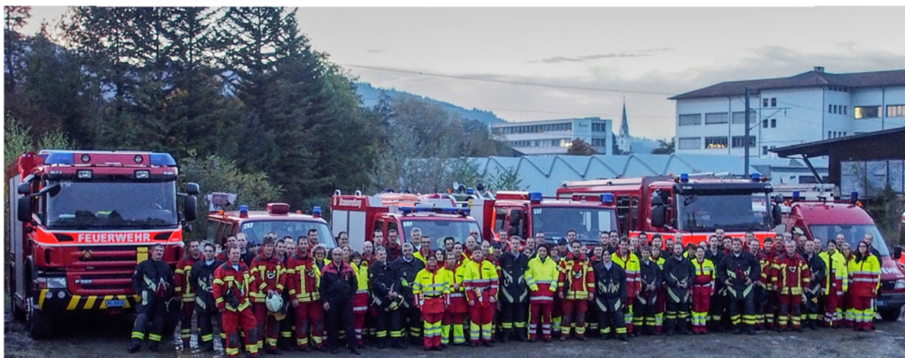
Das erste gemeinsame Gruppenfoto entstand bereits vor der Fusion (Herbst 2013)